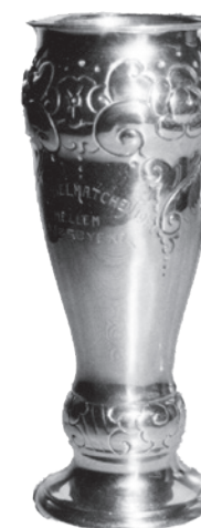
Sølvpokalen som Gjøvik vant i triangelmatchen i 1926.