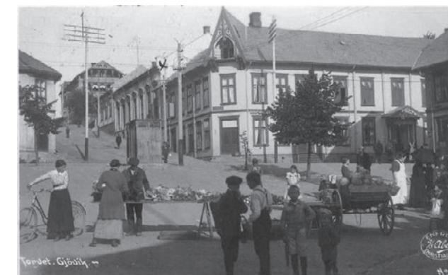
Gjøvik Arbeidersamfund der byens sjakkklubb hadde spilsted, kanskje også fra starten i 1908.

Tre menn med ulike typer posisjon i byen med omegn sto i spissen for den nye klubben. Formann var den unge lens-