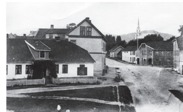
Gjøvik på starten av 1900-tallet. Kauffeldtgården til venstre.